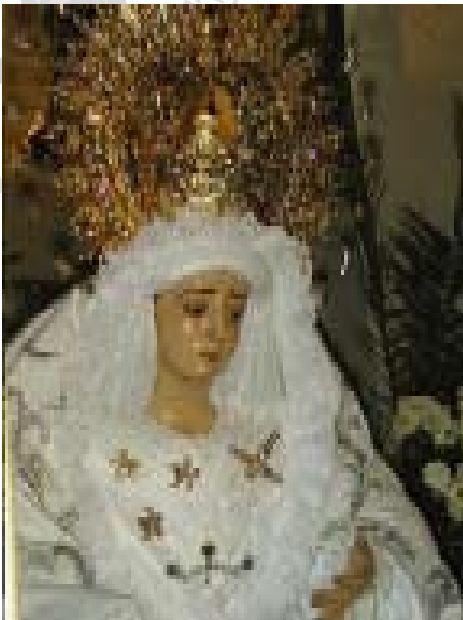
María Santísima de la Esperanza