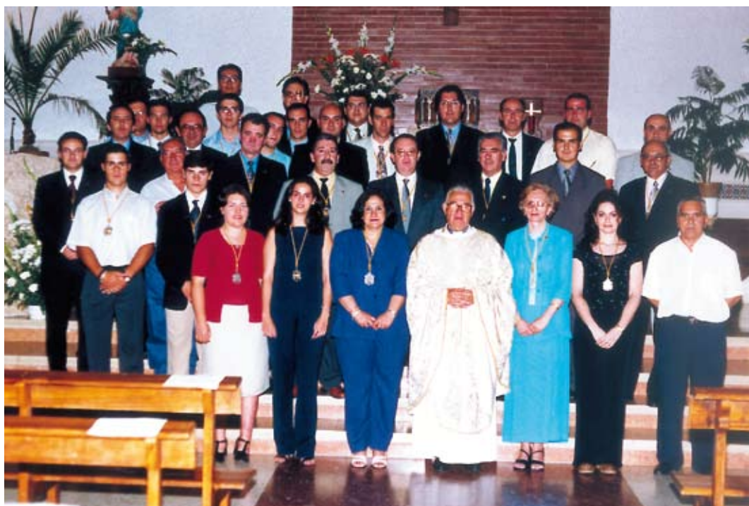
Toma de posesión de la nueva Junta de Gobierno, celebrada el 9 de Junio de 2001, Parroquia de San Cristóbal.