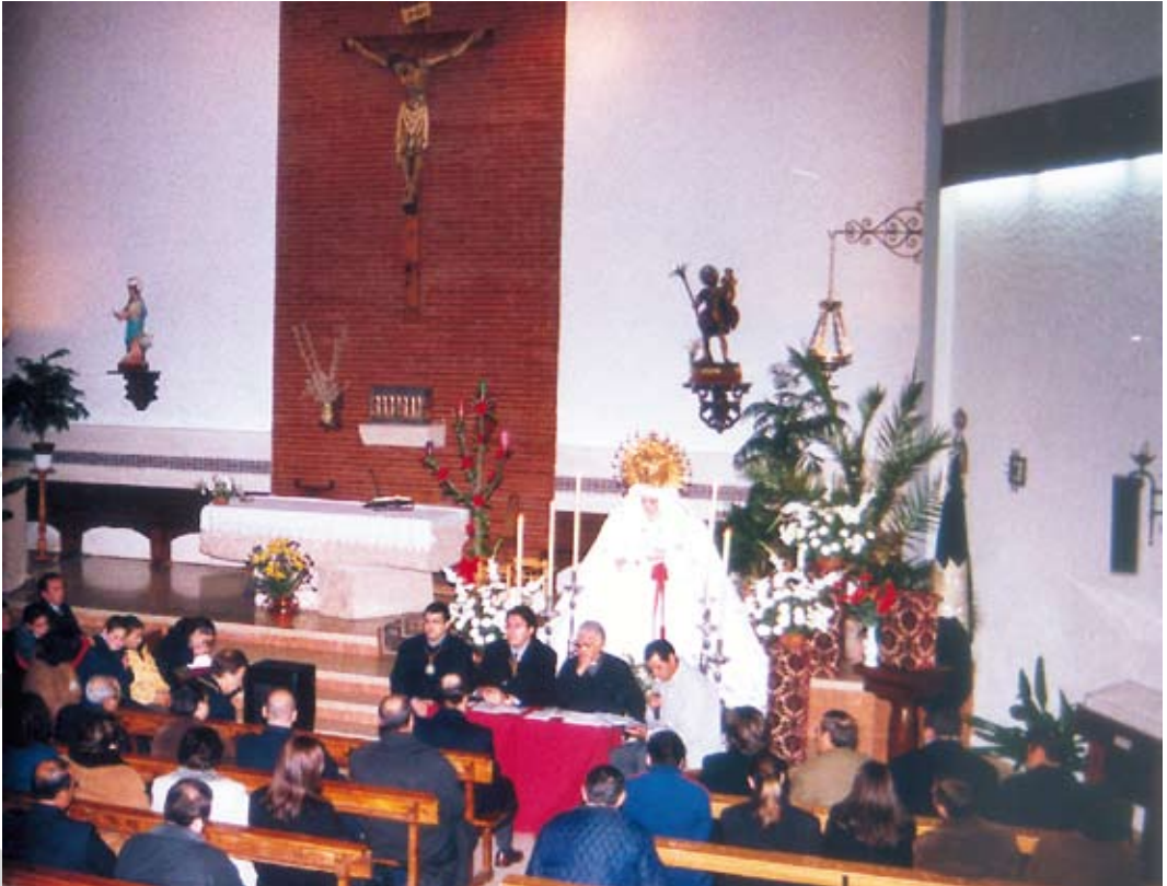
Cabildo Extraordinario celebrado el 15 de Diciembre, donde se aprobó la adquisición de una nueva imagen de Ntro. Padre Jesús en la Columna.