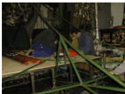
Montaje del nuevo paso de María Santísima de la Esperanza